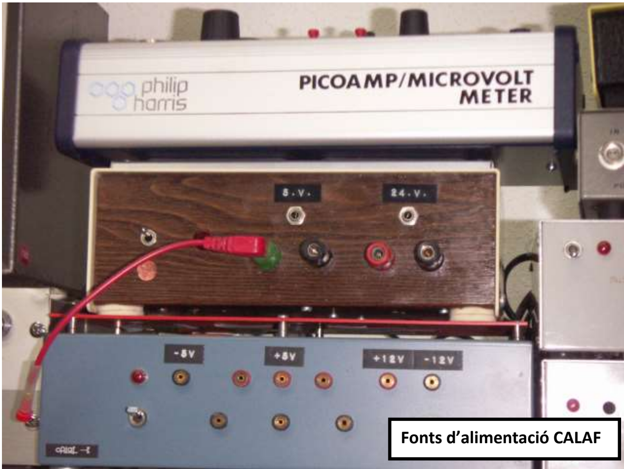
Fonts d'alimentació CALAF