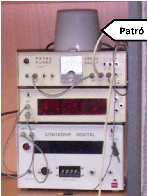
Patró quars catodeon