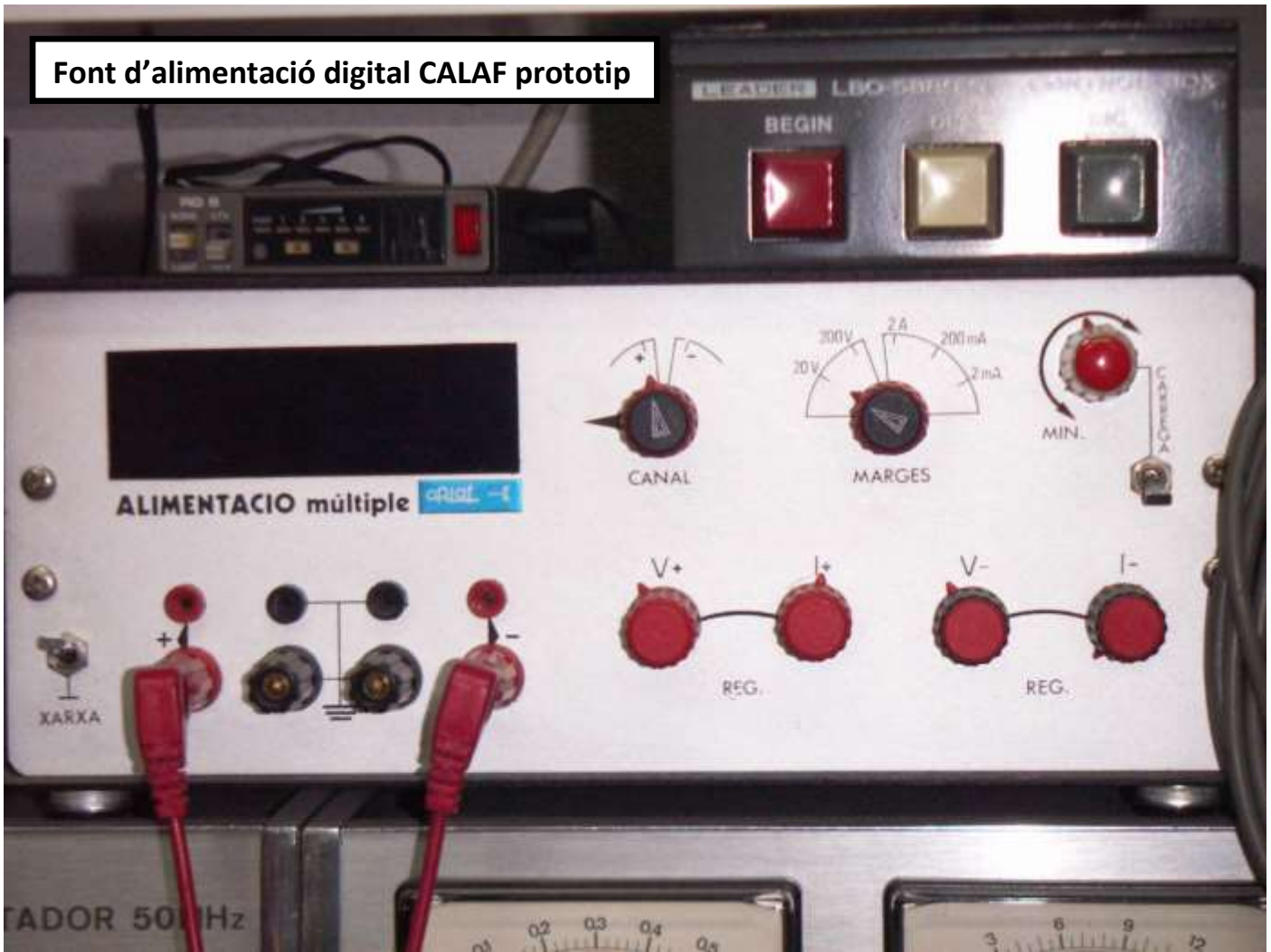
Font d'alimentació digital CALAF prototip