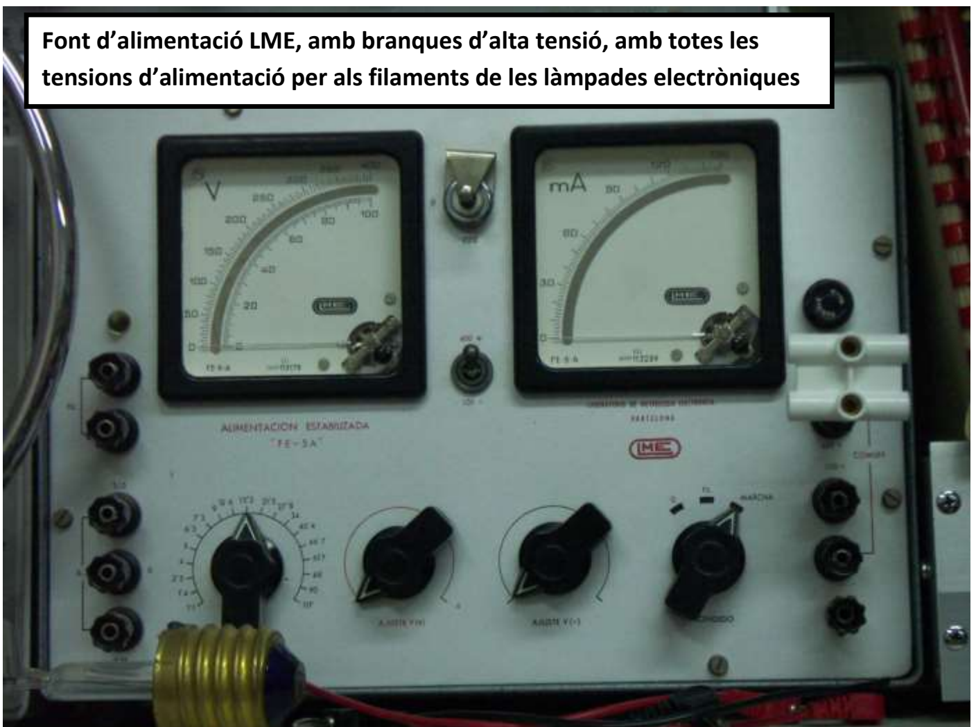
Font d'alimentació LME, amb branques d'alta tensió, amb totes les tensions d'alimentació per als filaments de les làmpades electròniques