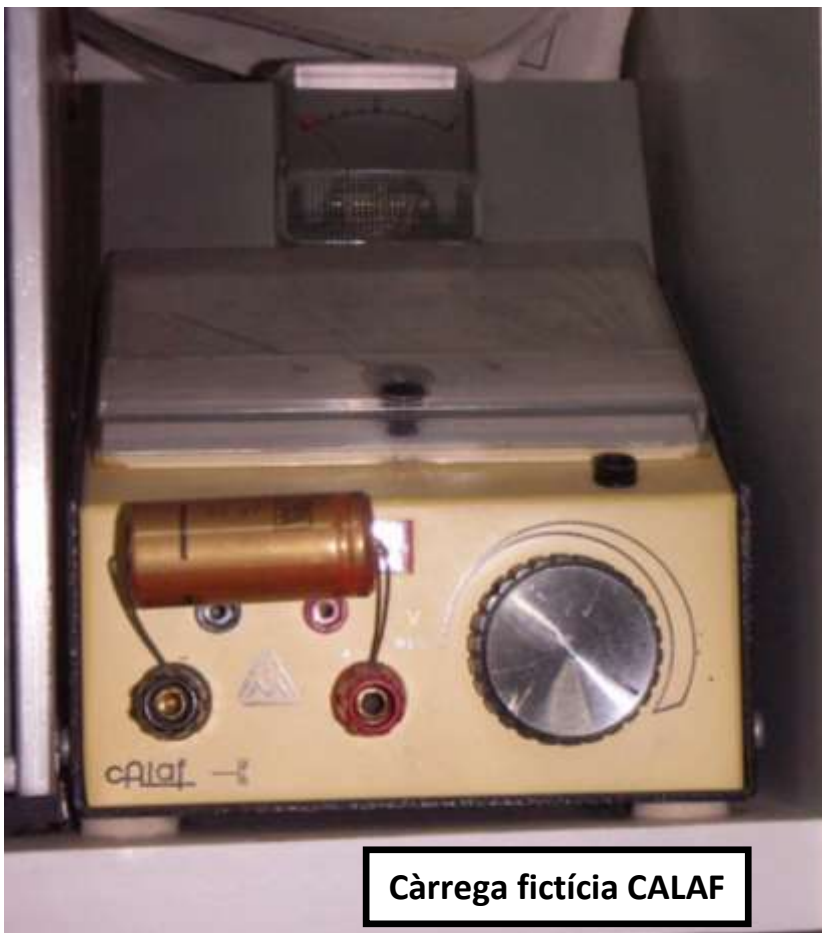
Càrrega fictícia CALAF